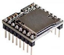
Общий вид устройства

Встраиваемый модуль представляет собой компактный MP3 плеер с возможностью локального и внешнего управления с помощью последовательных команд. Модуль позволяет воспроизводить файл формата MP3 с microSD карт с файловой системой FAT16 и FAT32. Модуль оснащен 3 Вт усилителем, поэтому к модулю можно непосредственно подключать динамик или акустическую систему. Модуль будет незаменим для систем голосовых подсказок, систем оповещения транспорта, технических и офисных помещений, детских игрушек. Аудио данные сортируются по папкам, поддерживает до 100 папок, каждая папка может содержать 1000 файлов. Максимальный размер поддерживаемых microSD карт до 32 Гб.