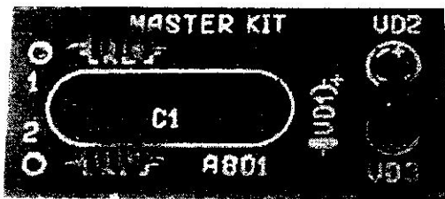
Рис.1 Общий вид устройства

Этот простейший тестер предназначен для проверки и поиска неисправностей электрооборудования Вашего автомобиля. Устройство имеет небольшие размеры. Общий вид тестера показан на рис.1, схема электрическая принципиальная – рис.2. Размеры печатной платы 42x20мм.