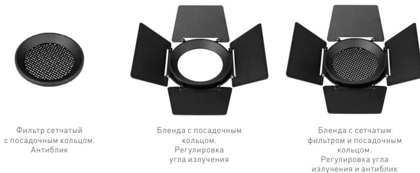
Рис. 1. Варианты исполнения аксессуаров

⚠ Техническое обслуживание и установка должны выполняться только квалифицированным специалистом.